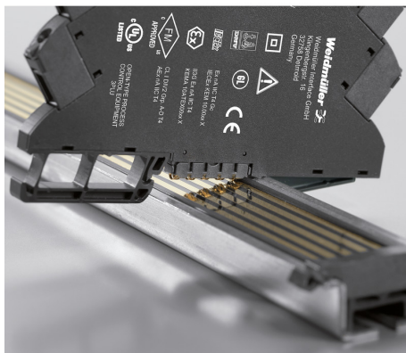
Power supply via CH20M DIN rail bus