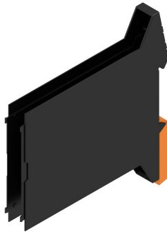
Illustration du produit