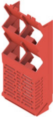
Illustration du produit