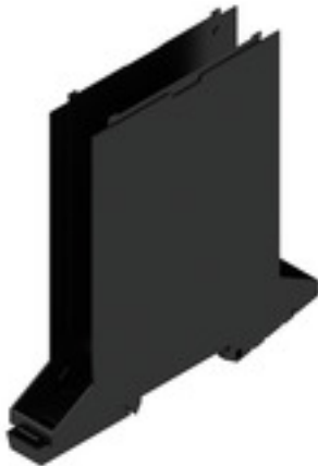
Illustration du produit