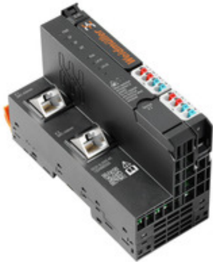
Illustration du produit, Similaire à l'illustration