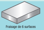
Fraisage de 6 surfaces