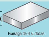
Fraisage de 6 surfaces